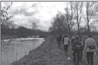
De laatste winterserietocht