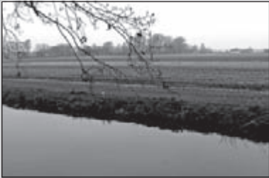
Voorjaar in de Keukenhof