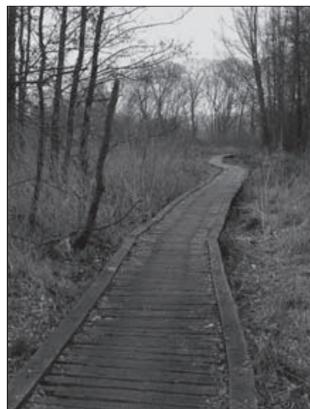
Planken brug over de Weertbeek in Smeetshof

In Stramproy moest als gevolg van een groot nieuwbouwplan de route enkele straten worden omgelegd, voordat de wandelaars zuidwaarts worden geleid