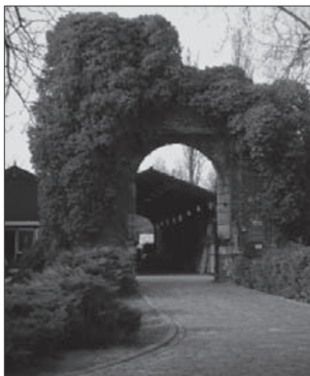
Ruïne toegangspoort kasteel Graaf van Horne

Om het verkeer langs de Zuid-Willemsvaart tot vrijwel nul te herleiden, wordt de westelijke ringbaan door de gemeente Weert steeds meer uitgebreid en van rotondes voorzien om de toenemende