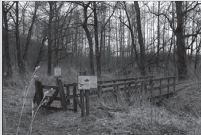
Ingang van natuurgebied Smeetshof bij de Belgische grens