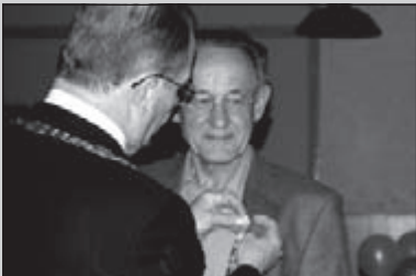
Veel OLAT-leden onderscheiden