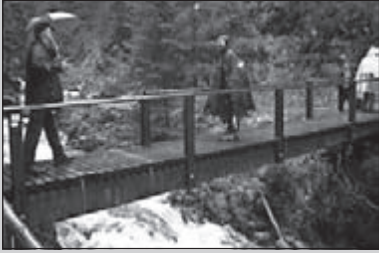
Avontuur in de Hoge Venen

CLUBBLAD VAN WSV OLAT • JAARGANG 35 • NUMMER 5 • MEI 2009